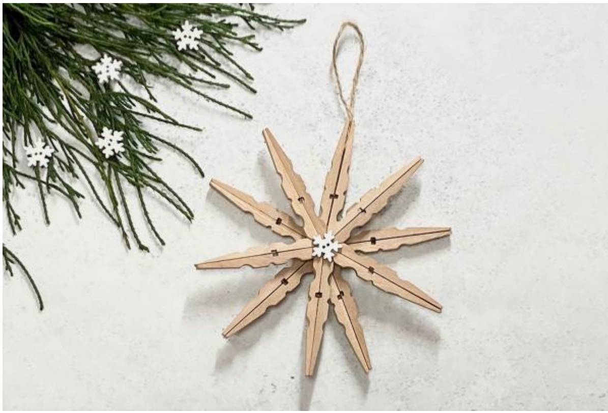
17. Takto vypadá hvězda k zavěšení třeba na stromeček.