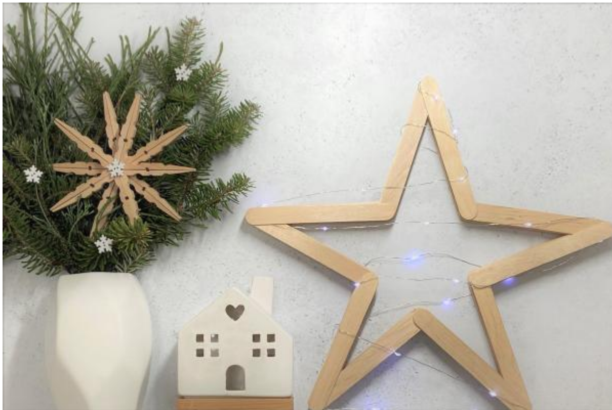
18. Vánoční hvězdu ze špachtlí a z kolíčků máme hotovou.